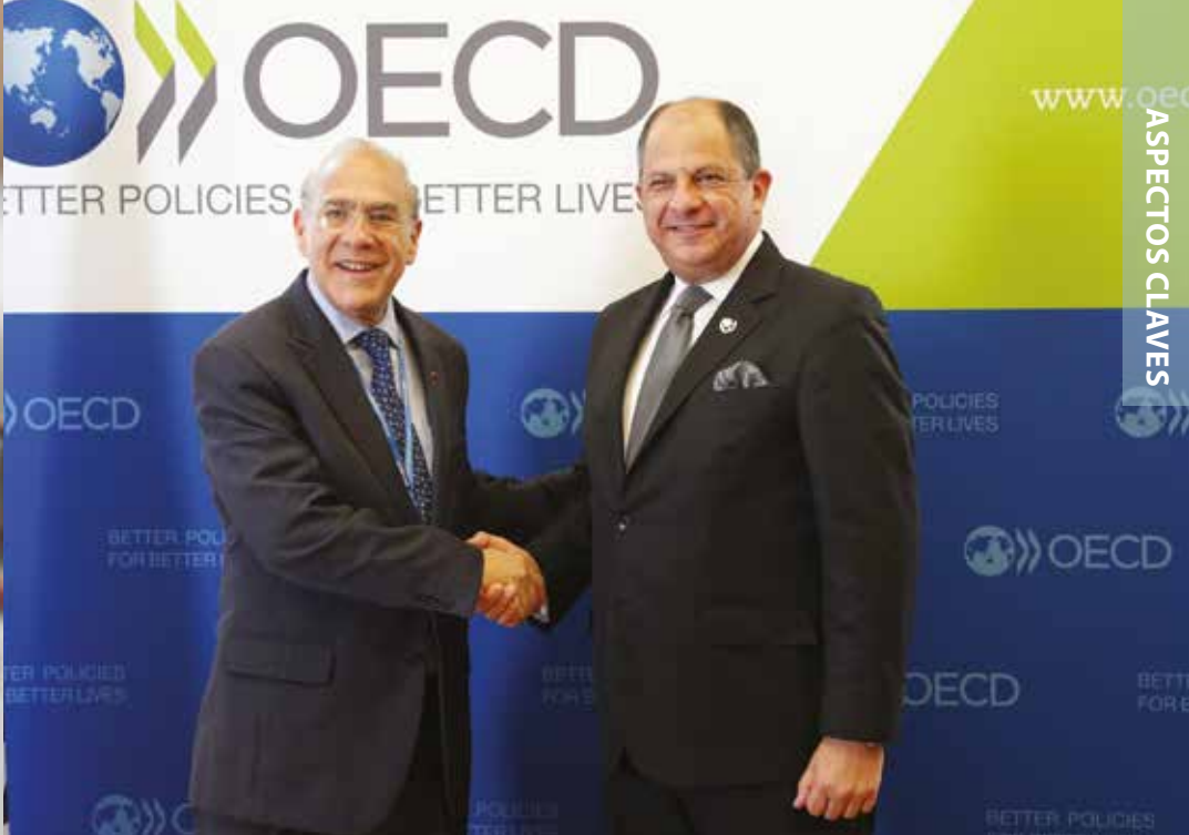
Angel Gurría, Secretario General de la OCDE, se reúne con el Presidente de Costa Rica, Luis Guillermo Solís, durante su visita oficial a la OCDE en París, el 5 de Junio 2015.

“El estudio suministra un diagnóstico exhaustivo de los principales retos que Costa Rica enfrenta en áreas clave de la administración pública, como es el caso de las capacidades del gobierno central y la integridad en cuanto a contratación pública. Estoy muy complacido porque el estudio no sólo genera una clara imagen de nuestra realidad, sino que también brinda una serie de recomendaciones para abordar los retos identificados. El gobierno está comprometido con la implementación de las medidas necesarias para promover en esta y en otras áreas, un cambio sustancial con el objeto de mejorar el bienestar de los ciudadanos y la eficiencia y efectividad del estado”